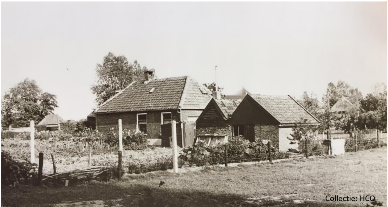
Bosweg 3 voor de reconstructie van Schellerenkweg en Bosweg in 1960.

De gemeente Zwollerkerspel heeft een reconstructie van de Bosweg en Schellerenkweg uitgevoerd. Bij de percelen Bosweg 1 en 3 had de weg een haakse bocht, evenals de afslag naar de Schellerenkweg. Dit zijn wat vloeiender bochten geworden zoals nu nog aanwezig. Tevens zijn langs de gereconstrueerde Schellerenkweg in de jaren '60 populieren geplant.