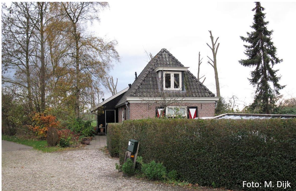
Bosweg 3 foto uit 2019

Tussen 1930 en 1947 Schelle B 204 en na 1947 Bosweg 3.