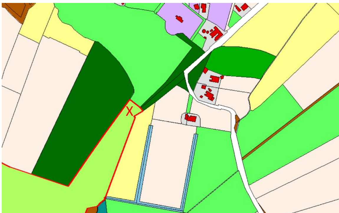
Kadastrale kaart uit 1832 waar het licht groene nog weiland is van de Marke Schelle. Bij het kruis de toekomstige woning Bosweg 3.