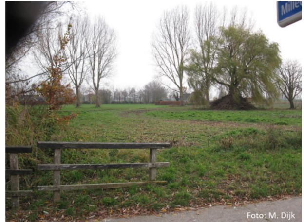
Locatie van verdwenen boerderij Kleine Veerweg 15. Situatie 2019, bij brugje in het van Rechterenpad.