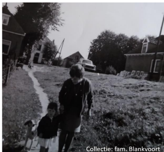
Het oude toegangspad naar nr. 22.