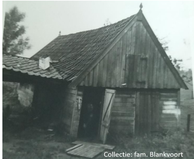
Een oude schuur, 19?