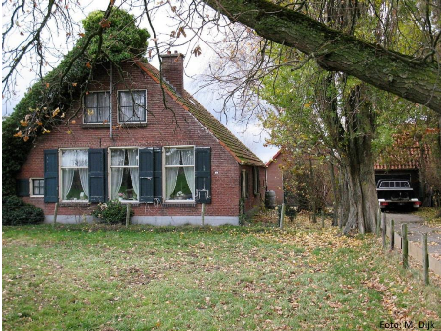
Boerderij zoals die in 1950 gebouwd is, anno 2019.