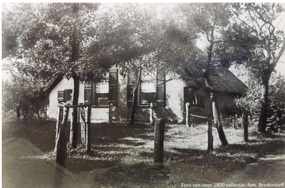
Boerderij vanaf 1878 tot verbouwing in 1950.