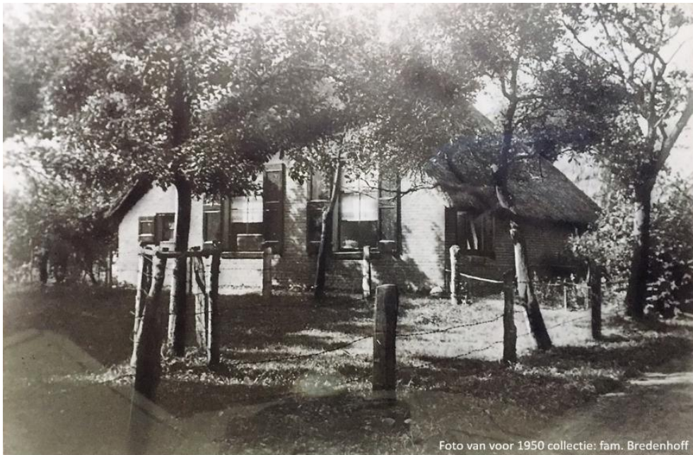
Boerderij vanaf 1878 tot verbouwing in 1950.