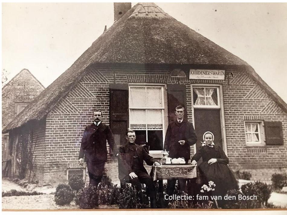
Boerderij tot verbouw 1919

Er worden 3 zonen geboren waarvan er één vroegtijdig overlijdt.