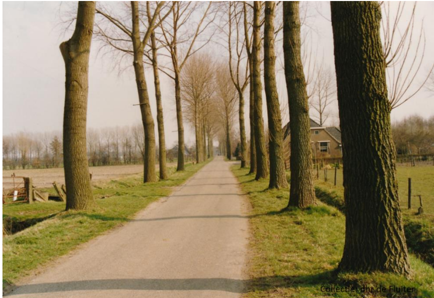
Foto Oldeneelweg uit 1993.