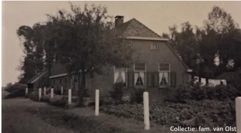
De boerderij uit mogelijk jaren '30 of '50.