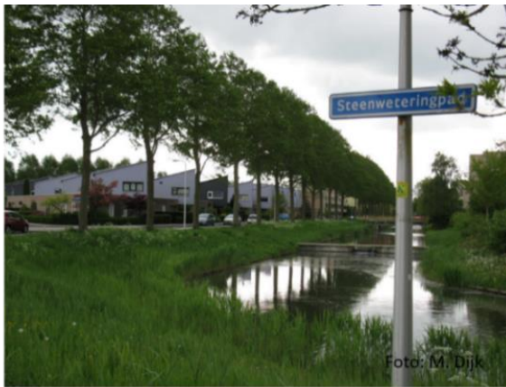
Locatie waar tot 1994 de woning Oldeneelweg 13 heeft gestaan