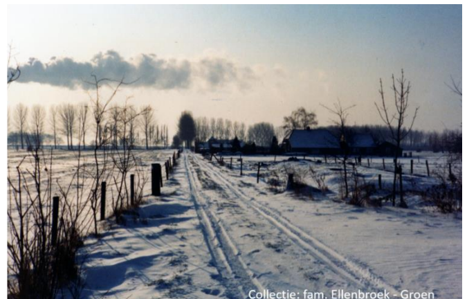
Collectie: fam. Ellenbroek - Groen

Nog een beeld vanaf Oldeneelweg 13 richting nr. 15.