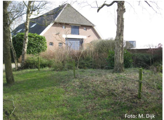
Situatie 2019, links voorkant rechts achterkant.