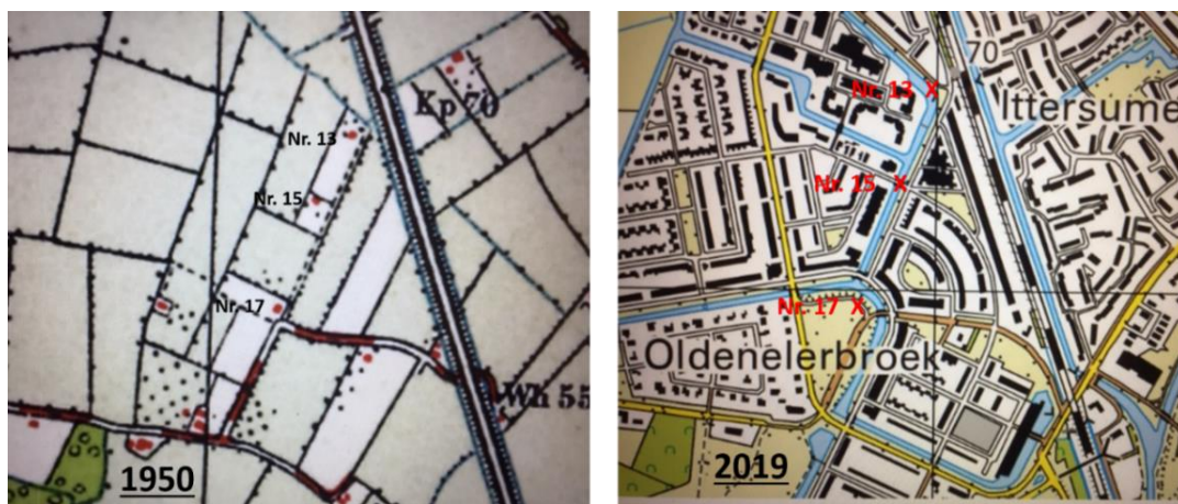
Links de kaart uit 1950 en rechts de nieuwbouw in 2019.