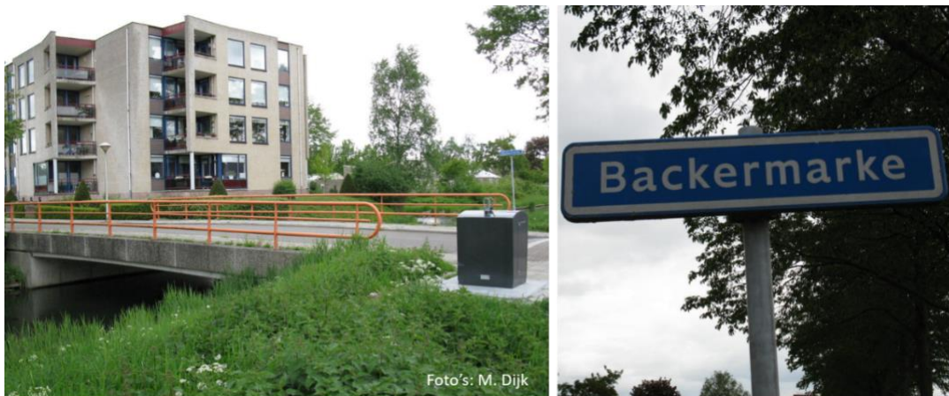
Locatie waar tot 1992 Oldeneel weg 15 heeft gestaan.

Tussen 1949 en 1959 is het adres Steenwetering weg 15, om daarna Oldeneelweg 15 te worden.