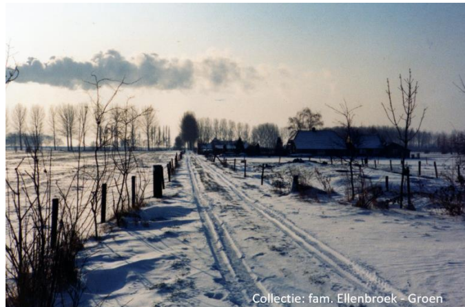
Winters weggetje vanaf nr. 13 richting nr. 15.

Willem en Alie van Olst – Bosch hebben tot 1992 met veel plezier aan de Oldeneelweg 15 gewoond. De uitbreiding van Zwolle – Zuid komt dichterbij, waardoor zij moeten wijken. Zij kopen in Heino een vrijstaande woning,