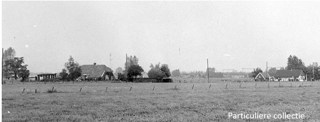
Jaren '80, Oldeneel weg 15 links en 13 rechts, genomen vanuit het zuiden.