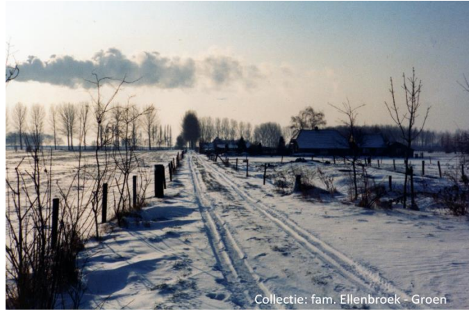
Winters weggetje vanaf nr. 13 richting nr. 15.

Willem en Alie van Olst hebben tot 1992 met veel plezier aan de Oldeneelweg 15 gewoond. De uitbreiding van Zwolle – Zuid kwam dichterbij, waardoor zij moesten wijken. Zij kochten in Heino een vrijstaande woning,