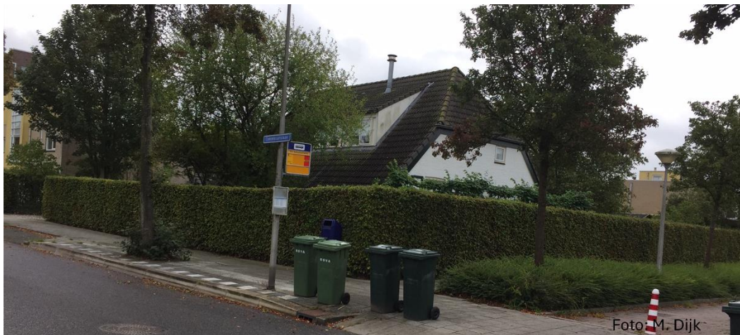
Situatie 2019. Commissarissenlaan.

Nadat dit huis/boerderijtje gebouwd is in 1851 krijgt het door de gemeente Zwollerkerspel als adres Oldeneel met huis nummer 20. Na een omnummering in 1910 krijgt het als adres Oldeneel B 137, dit tot 1930 dan veranderd het adres in Oldeneel B 164. Dan komt er weer een adres verandering in 1949 en wordt het Steenweteringweg nr. 18, om in 1959 te veranderen in Oldeneelweg 18.