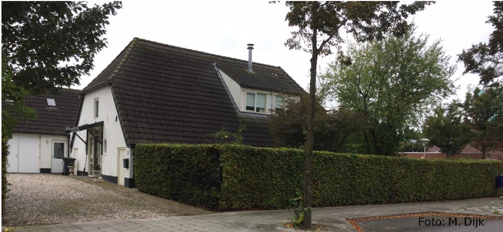
Situatie 2019 Commissarissenlaan