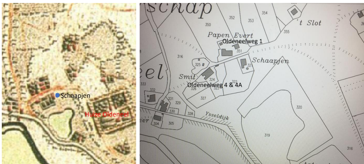
Links de Hottinger kaart uit 1787, bij blauwe stip de Katerstede/Keuterboerderij, Schaapjen.

De boerderij die in 1787 ook al op de Hottinger Kaart staat, krijgt na de kadastrale en gemeentelijke invoering, begin 1800, Oldeneel met huis nr. 12, dat bleef zo tot de sloop in 1890.