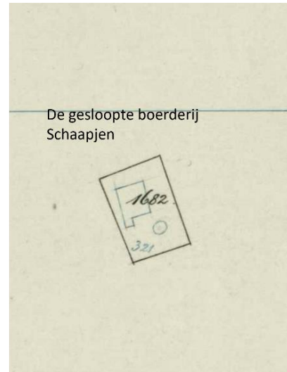
De in 1890 gesloopte boerderij Schaapjen met huis nr. Oldeneel 12 en het kadastrale nr. M 1682.