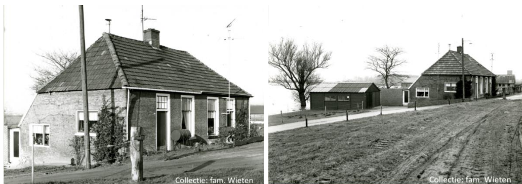
Foto, waarschijnlijk jaren '60 want er is tv, maar het uiterlijk zou ook jaren '30 of '40 kunnen zijn.