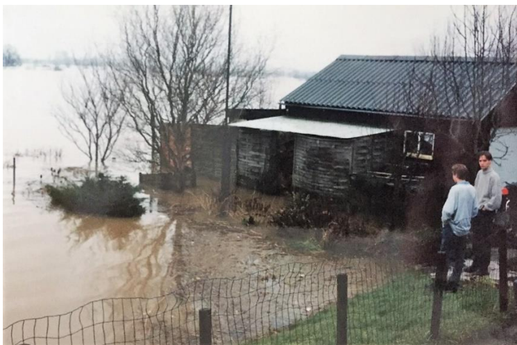
Hoogwater waarschijnlijk 1995, met buurjongens.