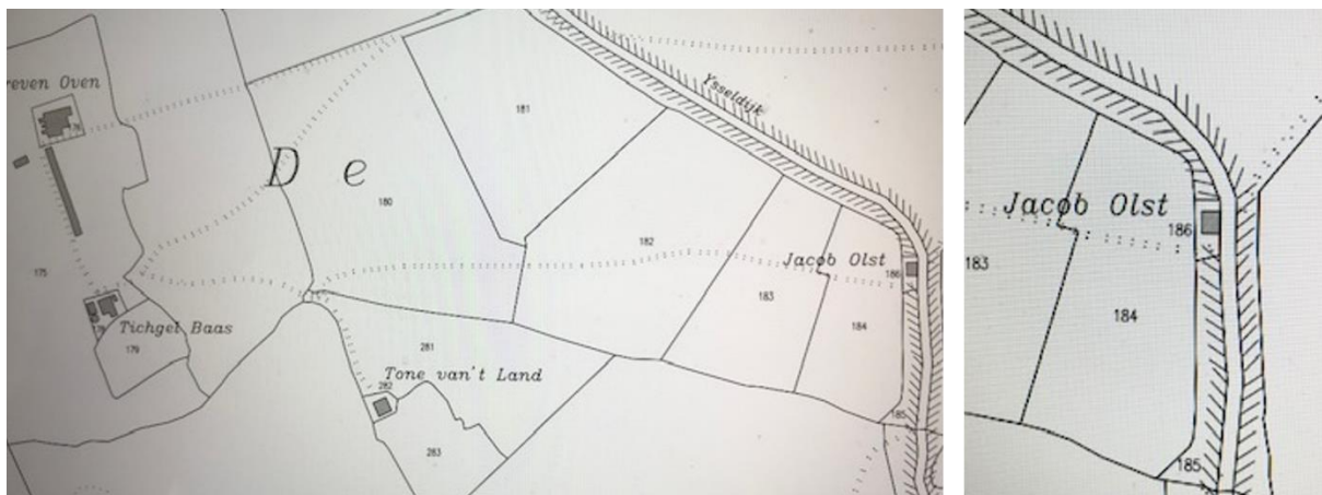
Kadastrale kaart uit 1832, de boerderij wordt in die tijd nog wel eens naar de huurder genoemd.