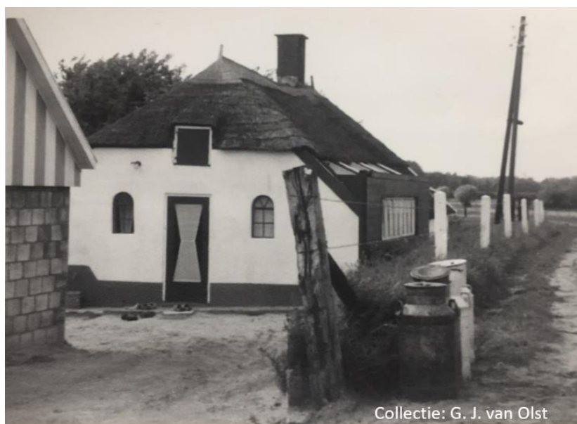
De oorspronkelijke boerderij met al een verbouwing, en links nieuwe veestal.